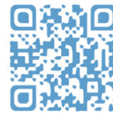
Site web du colloque